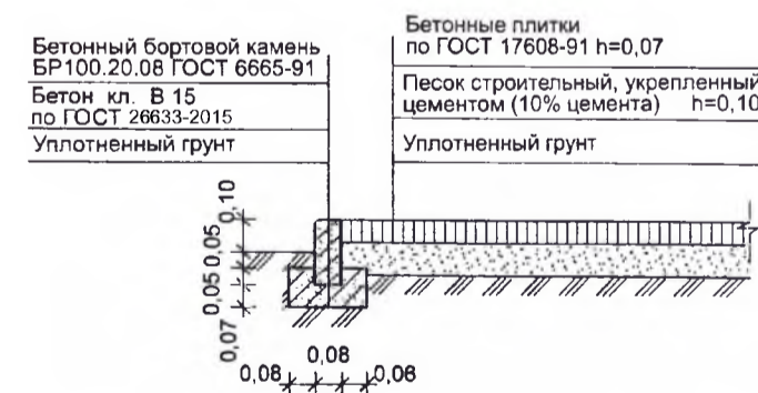
Покрывание бетонной плиткой (тротуары)

1. Для устройства газона рекомендуется использовать травосмесь: мятлик луговой - 20%, овсяница красная-40%, райграс пастбищный-40%. Норма высева семян 1,0-1,5 кг на 100 м2. Семена заделывать на глубину 1,5-2,0 см. 2. В клумбах разбить цветник из многолетников и однолетников.